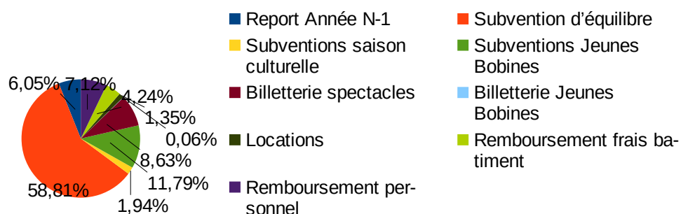
Répartition recettes 2019

Le festival Jeunes Bobines se déroulant en fin d'année, certaines dépenses et recettes peuvent être imputées sur l'exercice précédent ou sur l'exercice suivant.