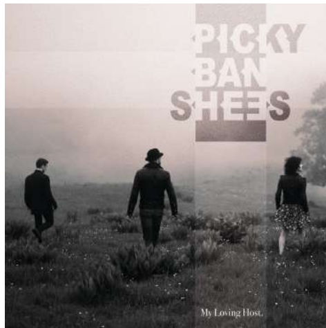
EP « My Loving Host » 2018