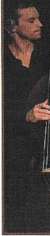
Repérés par le belles surprises