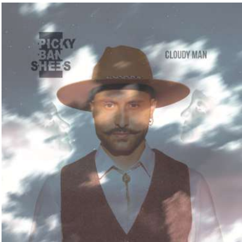
EP « Cloudy Man » 2020